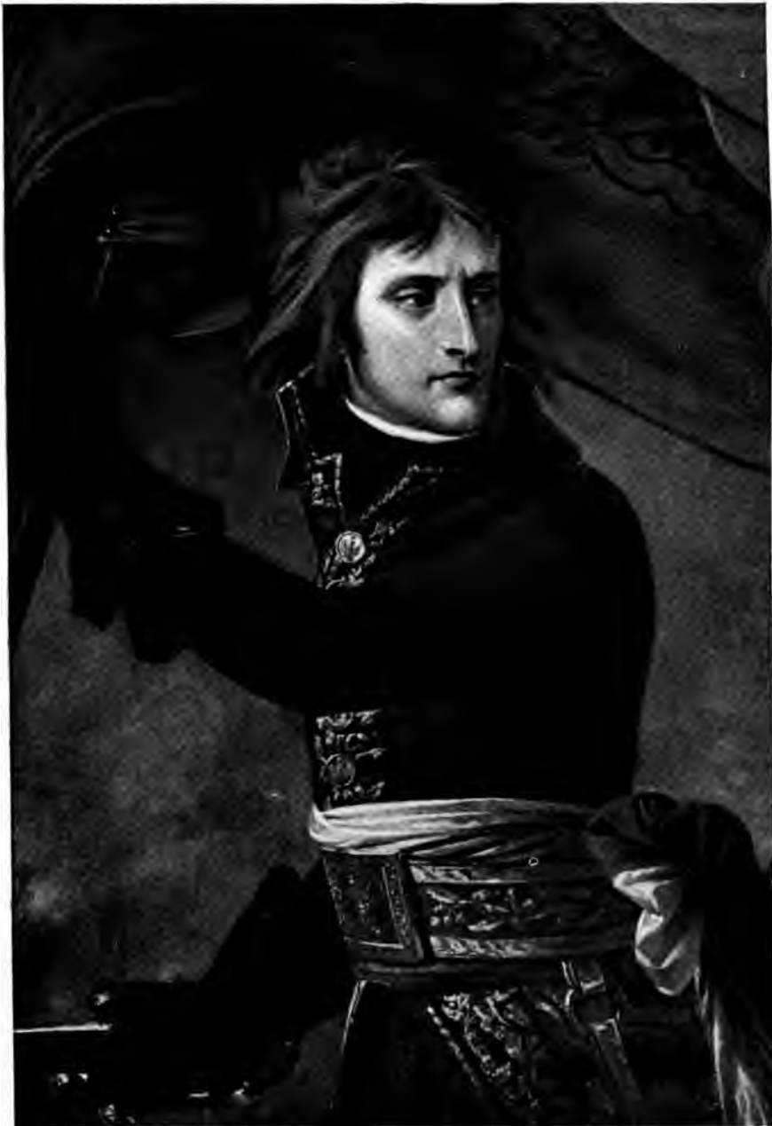
BONAPARTE A ARCOLE par Gros.